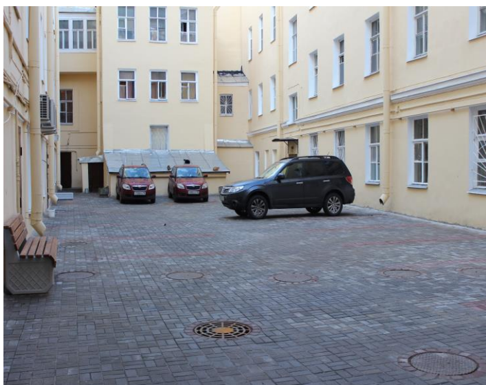
Дворовая территория после выполнения работ по благоустройству ул. Декабристов д.31