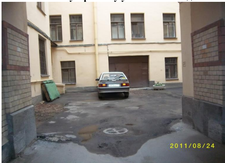
Дворовая территория до выполнения работ по благоустройству ул. Псковская д.5