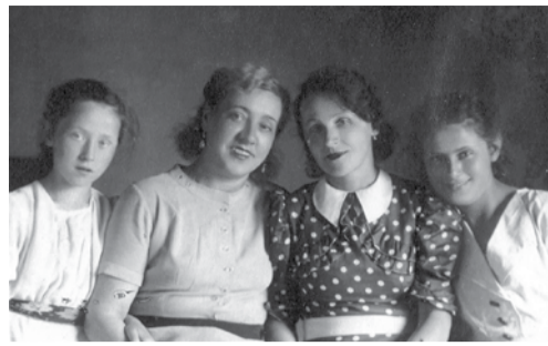
«Салют по привычке показался мне грохотом обстрелов...»

Так пусть же мир сегодня слышит салюта русского раскат. Да, это мстит, ликует, дышит! Победоносный Ленинград! О. Бергольц