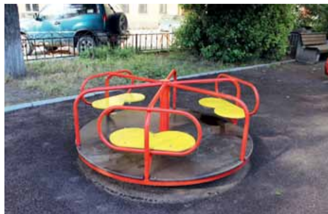
Английский проспект, д.17—19: демонтаж сломанной карусели, установка новой карусели «Звездочка».

УЛИЦА ПСКОВСКАЯ, Д. 22: песочный городок.