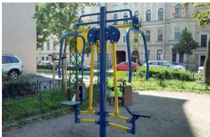
Макаренко переулок, д. 4: 2 уличных тренажера.