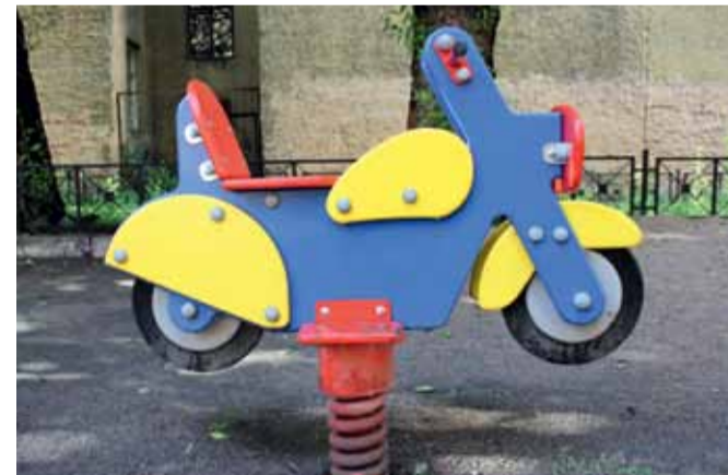
Улица В. Ермака, д. 5/6: качалка на пружине, 3 уличных тренажера, демонтирована старая горка и установлен новый детский игровой комплекс.