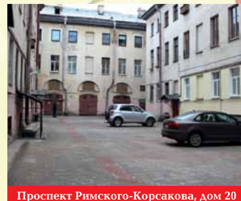
Проспект Римского-Корсакова, дом 20