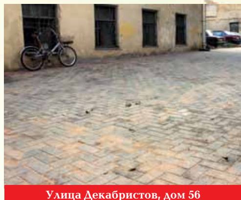
Улица Декабристов, дом 56