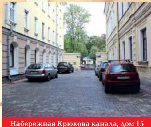
Набережная Крюкова канала, дом 15